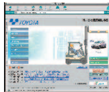
豊田自動織機 WEBトップ画面

発注先と、仕事の進み具合の報告、問題点、今後の方向性などを話し合う必要があり、体調と作業スピードを考慮して2週間に一度のミーティングを設定しています。