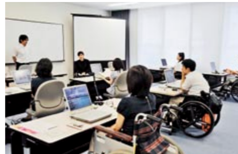
▲半年に一度、一泊二日で行われるスキルアップ研修は、日頃1人で作業することが多い在宅雇用者が、リパブル社員であることを自覚できる場でもあります。夜は懇親会を行い、社員同士の親睦を深めます。

雇用当初は、初心者でも簡単に間取図を作成できるデジタル間取図ソフトを使用していましたが、画質が劣ることなどから、より高度な作業ができるイラストレーターを導入。ウィーキャン世田谷のサポートによるスキルアップ研修を積み重ねて、在宅雇用者全員が使いこなせるようになってきました。現在は間取図だけでなく、不動産物件への案内地図の作成にも取り組んでおり、業務内容を充実させることにより在宅雇用の拡大を図っています。