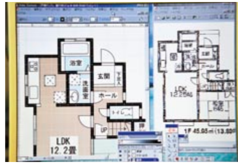
▲間取図はPDFの下絵(画面右)を基にして作図します。会社の仕様書に沿って作成することが重要です。

在宅雇用者の主な業務はホームページやチラシに掲載する間取図の制作で、発注された間取図を決められた時間内に納品することが求められます。業務の分配や進捗の管理、出来上がった間取図の検品は、当初は間取図作業を統括する部署の担当者が行っていましたが、現在は在宅雇用社員によるチーム体制を整え、各チームのリーダーが行っています。チーム制を導入したことで、在宅雇用者の責任感が高まり、やる気につながっています。