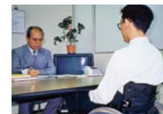
一人ひとりの能力とニーズに合わせた 仕事を紹介し、障害のある方の就業を 支援しています。