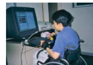
Web、データベース、プログラミング、 DTPなど、SOHOの活躍の場をサポート しています。