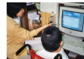
在宅で情報処理技術を学ぶ、IT技術者 在宅養成講座を開講しています。